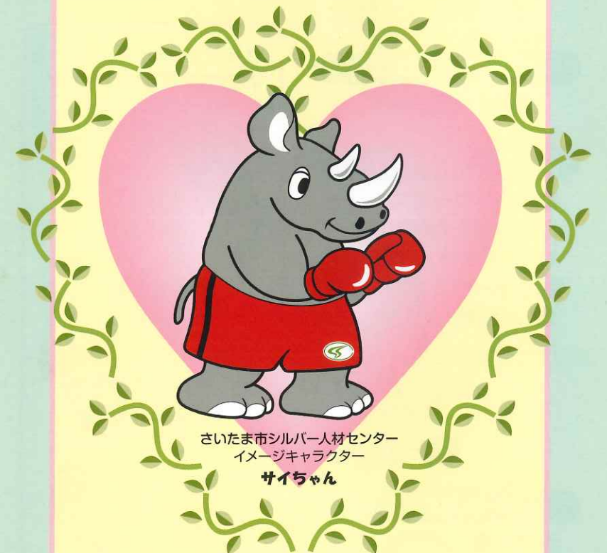
さいたま市シルバー人材センター イメージキャラクター サイちゃん